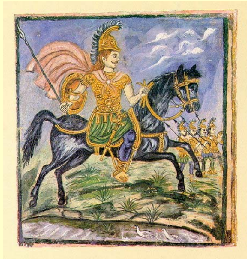
Ο Μέγας Αλέξανδρος του Θεόφιλου