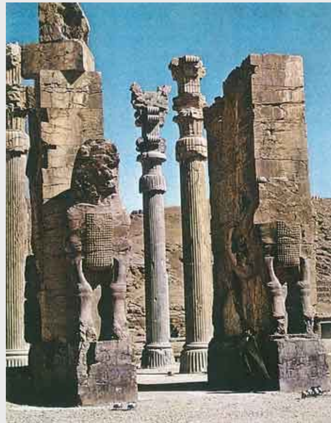
Η είσοδος του ανακτόρου των Αχαιμενιδών στην Περσέπολη

Ο Αλέξανδρος σεβάστηκε και διατήρησε τις προϋπάρχουσες διοικητικές δομές (π.χ. Το θεσμό της σατραπείας). Η προσπάθειά του όμως να συνδυάσει αρμονικά τις ιδιότητες του «πρώτου μεταξύ ίσων» Μακεδόνα ηγέτη και του «στρατηγού αυτοκράτορα» της πανελληνίας συμμαχίας με εκείνη του απόλυτου μονάρχη της Περσίας δεν έγινε αποδεκτή από τους Μακεδόνες και τους υπόλοιπους Έλληνες και αποτέλεσε σημείο τριβής στις σχέσεις του ακόμη και με τους στενότερους συνεργάτες του, που δεν μπορούσαν να ανεχθούν την αυλική εθιμοτυπία των Αχαιμενιδών (π.χ. προσκύνηση)