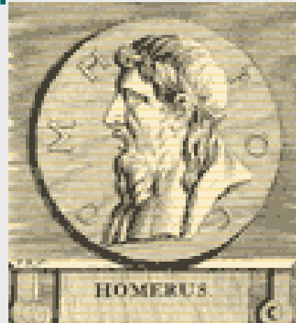
Όμηρος. Χαλκογραφία του 1701 από την Ουτρέχτη

«Ο Αλέξανδρος, όταν έφθασε στην Τροία, θυσίασε προς τιμήν της Αθηνάς, της προστάτισσας της πόλης και αφιέρωσε την πανοπλία του στο ναό. Επήρε δε από εκεί μερικά από τα ιερά όπλα που σώζονταν από την εποχή του Τρωικού πολέμου. Και λήγουν ότι οι υπασπιστές του κρατούσαν αυτά τα όπλα μπροστά του σ' όλες τις μάχες... Και ο ίδιος ο Αλέξανδρος στεφάνωσε τον τάφο του Αχιλλέα... και όπως λέγεται εμακάρισε τον ήρωα, επειδή του έτυχε η ευτυχία να έχει τον Όμηρο ως υμνητή του και να διατηρηθεί η μνήμη του στους αιώνες». (Αρριανός, Αλεξάνδρου Ανάβασις , 1, 11, 7 – 12.1, μετ. Β.Σ.) (Πρόσθετο παράθεμα από το βιβλίο του Εκπαιδευτικού σ. 100)